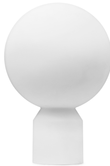
Yo Table Lamp Large